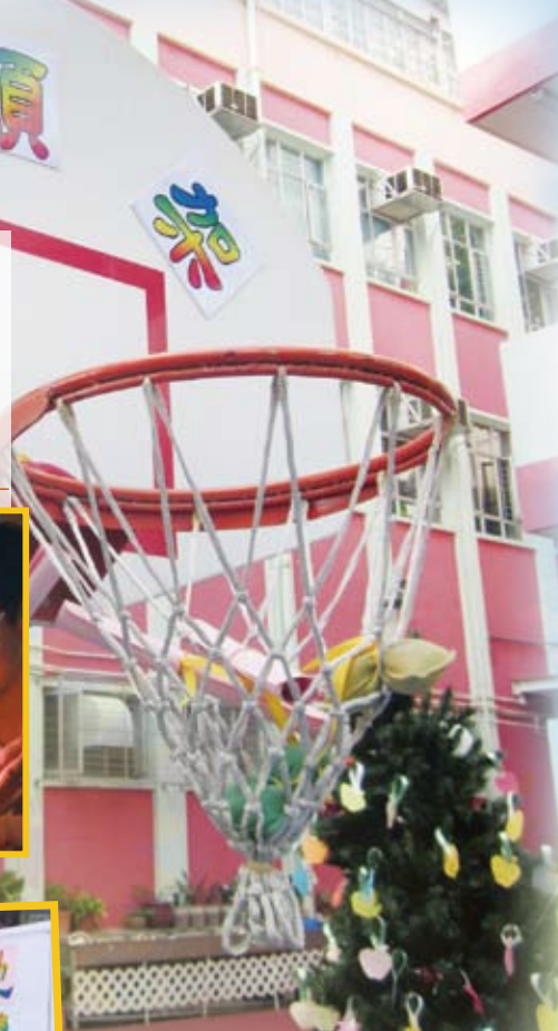
許願架——投擲決志書 祈求夢想成真