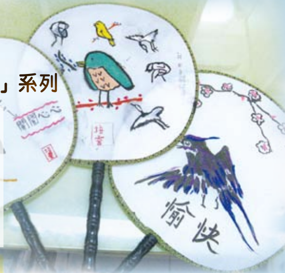
用心繪畫扇子贈長者

學生在視藝課時完成水墨畫扇，然後在探訪長者中心時，將作品連同心意卡親手送給長者。探訪後，在英文寫作課中，科任老師與學生回顧當天經歷，並記錄下來。