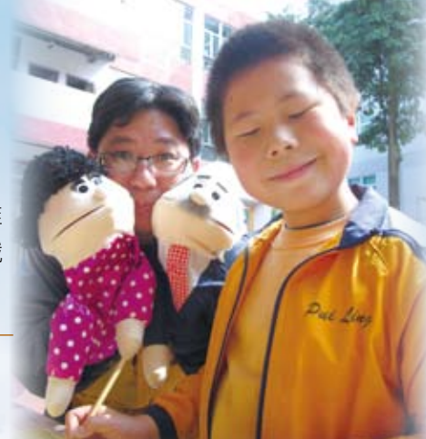
老師獻上珍藏物品 同學學習珍惜之道