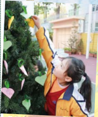
許願卡 — 反思自己的不足，為達成夢想而決志。