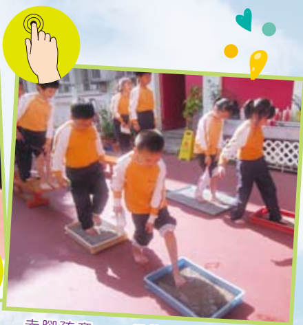
赤腳孩童 — 用腳感受戰地孩童的步步驚心