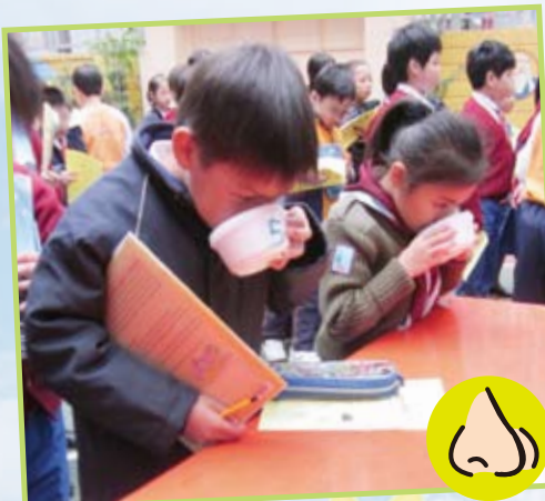
大鼻子挑戰站 — 體味大自然不同的氣息