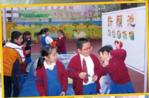
許願池——為祖國未來的發展而禱告