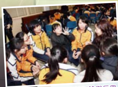
體驗活動後，進行小組討論與反思