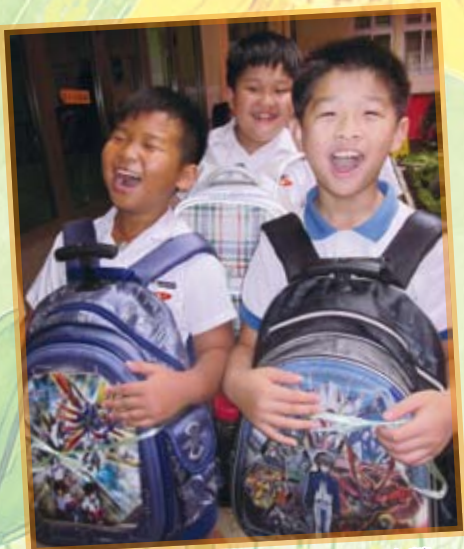
腹大便秘 — 體驗懷胎十月的辛勞