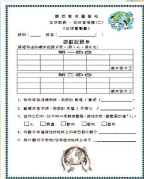
反思工作紙 — 協助自我檢視價值觀