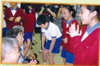
探訪老人院 — 實踐服務人群的校訓