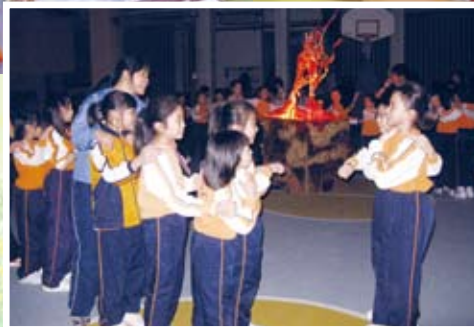
小三生命成長體驗營—— 為成長階段作小結