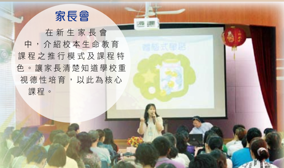
新生家長會 — 簡介校本生命教育課程

在新生家長會中，介紹校本生命教育課程之推行模式及課程特色。讓家長清楚知道學校重視德性培育，以此為核心課程。