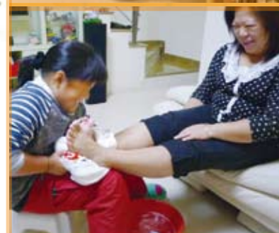
課程延展 — 為家人沐足