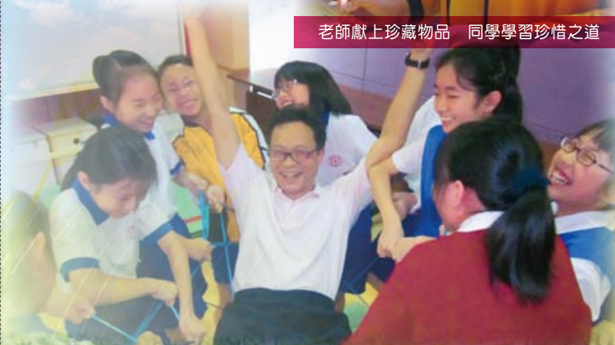
師生同享成長過程的喜與憂