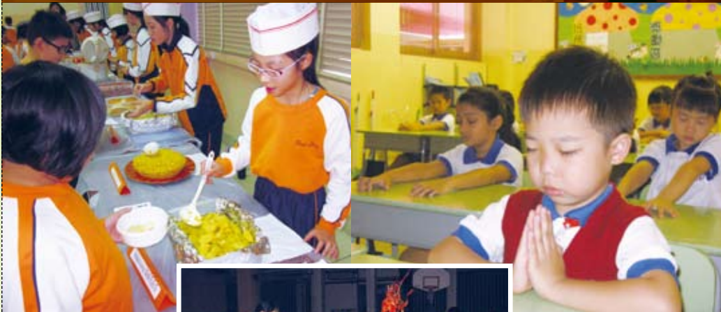
珍惜食物大行動—— 統整教學珍惜資源