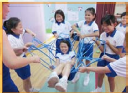
蜘蛛網 — 團隊互信由繩起

透過不同的活動，讓學生從中體驗，作自我反思，從而建立或修正個人的價值觀。與文字或言語的說教方式相比，顯得更有說服力。