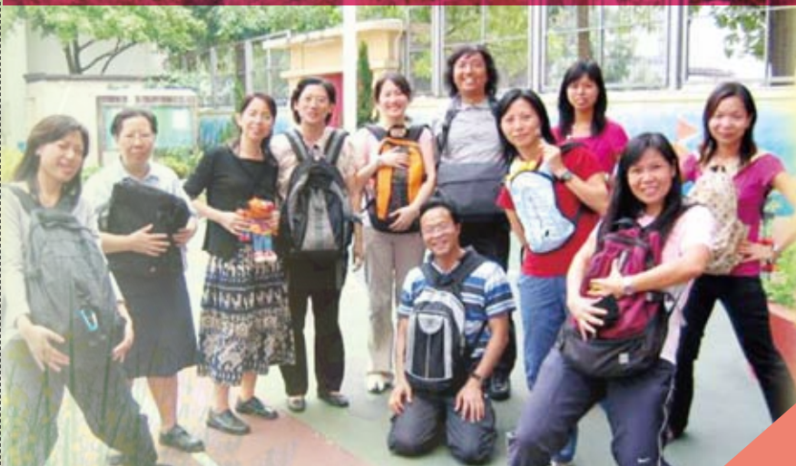
老師也陪伴學生集體懷孕