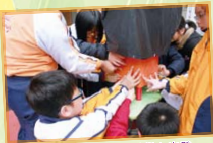
水桶陣 — 舉手之勞從心出發