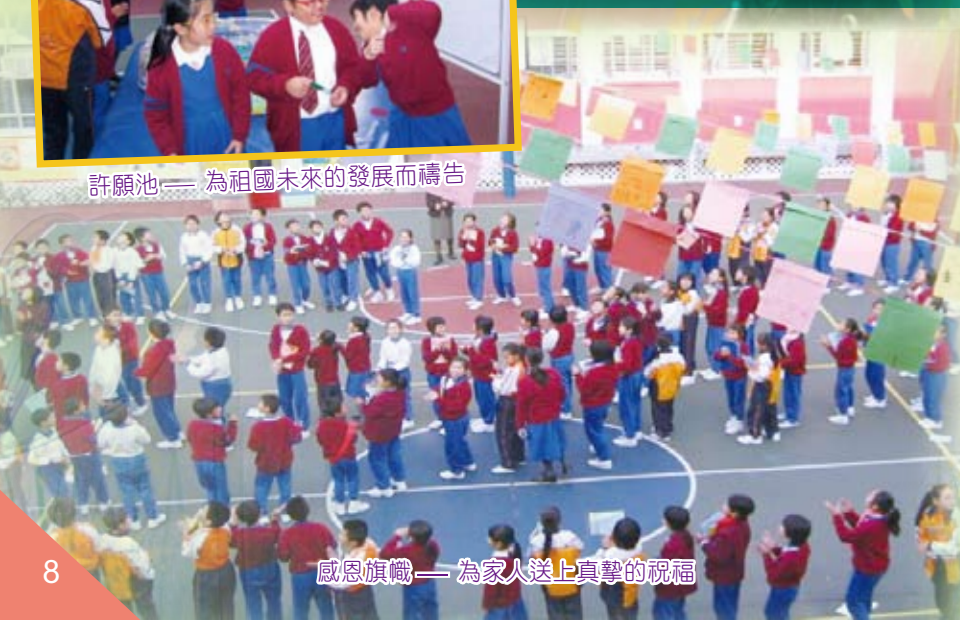
感恩旗幟——為家人送上真摯的祝福