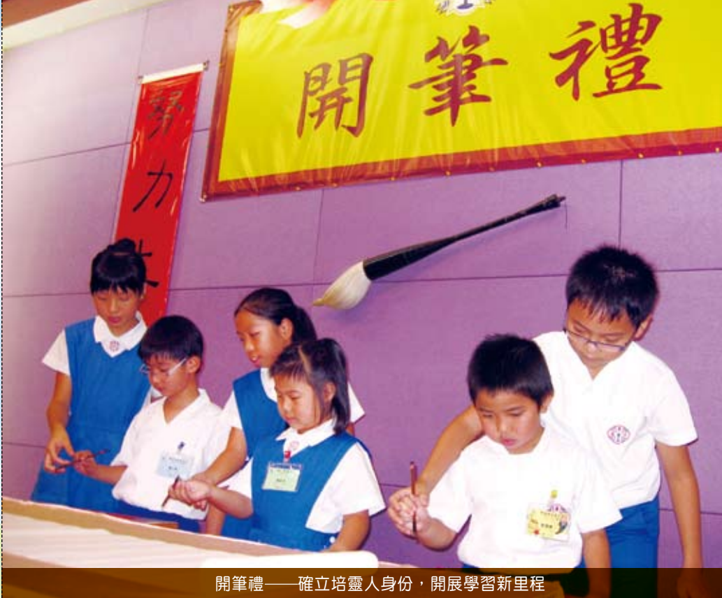
開筆禮——確立培靈人身份，開展學習新里程