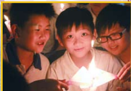
燃點心火——將服務他人的心火延續

每個系列的結束前，以不同形式的感恩活動帶領學生感受身邊人的重要、世界的美好、天主的恩賜，從而學會惜福感恩。